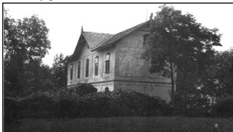
Bývalý kláštor, zbúraný bol pred pár rokmi. (pokračovanie nabudúce)

Za kláštorom pri ceste vedúcej z Ružovej doliny do Šelpíce stál krásny poschodový dom (vila) obklopený ihličnatými stromami. Strop tohto domu bol vyzdobený prekrásnou farebnou keramikou.