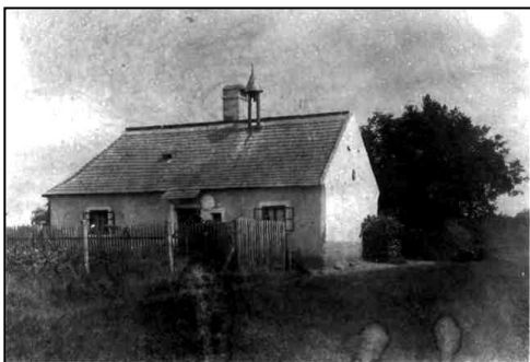
Domček, v ktorom býval môj dedko, keď bol hájnikom, mal 5 detí

Páni sem dochádzali na kočoch, cesty tu boli dobre udržiavané a do Doliny bol zakázaný vstup žobrákcom. V lete tu páni oddychovali, zabávali sa a na zimu odchádzali späť do Trnavy. Pániam sa vtedy hovorilo „pani veľkomožná“ a pri stretnutí sa im bozkávali ruky.